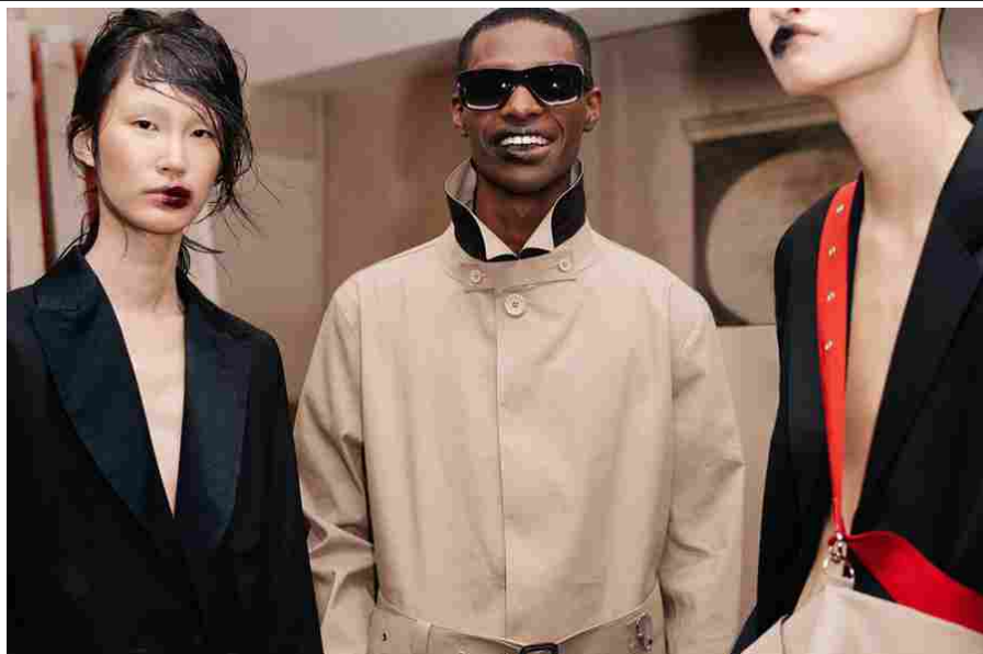
Matthew Miller special guest di White Man & Woman

Sempre nel segno della sperimentazione e di un menswear d'avanguardia è la scelta di Matthew Miller quale Special Guest di White Man & Woman , che approda per la prima volta a Milano , dopo aver vinto, The 2017/18 International Woolmark Prize for Menswear . Formatosi alla Manchester Metropolitan Art School e con un master Royal College of Arts , conseguito nel 2009, Miller lancia il suo brand nel 2010, che si caratterizza per il mix non convenzionale di elementi sartoriali e materiali tecnici.