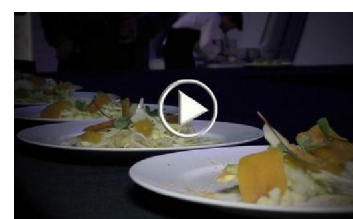
Longino & Cardenal entra negli Usa