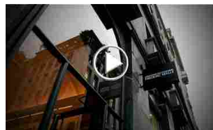
Frédéric Malle profuma Milano