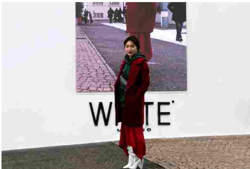
Un'immagine da White Milano

White Milano chiude l'edizione di febbraio registrando un numero complessivo di visitatori in crescita del 12% a quota 25.905. I buyer, in particolare, hanno registrato un aumento del 16%, con gli italiani in crescita del 14% e gli stranieri del 28 per cento. I marchi presenti al salone patrocinato dal comune di Milano sono stati invece 551, dislocati su una superficie di oltre 21mila mq (+8,5% rispetto alla stessa edizione l'anno scorso).