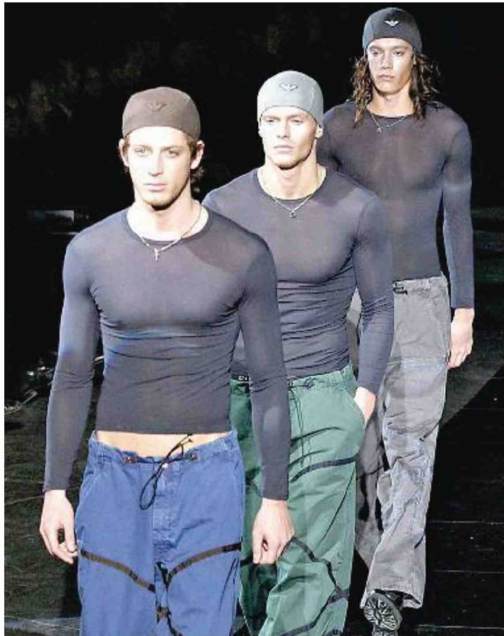
LO STILE Modelli che sfilano per Giorgio Armani in una delle ultime passerelle del grande maestro della moda