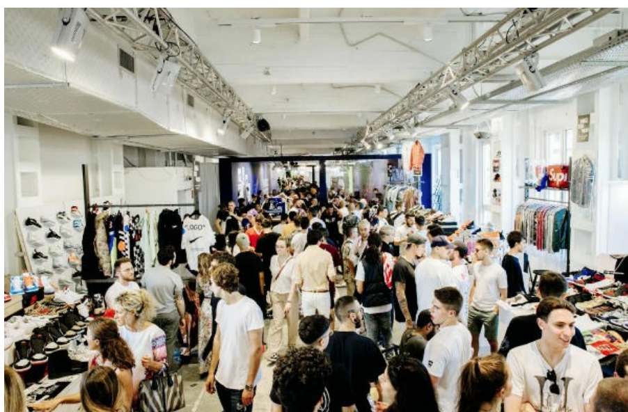
Un'area di White Street Market

White Street Market scalda i motori per la seconda edizione (12-14 gennaio 2019), preannunciando diverse novità sia dal punto di vista dell'offerta, sempre più consumer oriented, sia da quello delle collaborazioni, realizzate nell'ottica del "fare sistema". Per il prossimo gennaio, infatti, White Street Market, l'evento b2c di White, ha collaborato con la Camera Nazionale della Moda Italiana (Cnmi) e Confartigianato Imprese al fine di sviluppare un'iniziativa di sistema negli spazi del Base|Ex Ansaldo , che sarà una sede delle sfilate in calendario e di uno showcase che vede protagonisti i principali showroom milanesi.