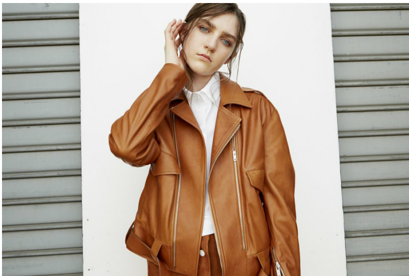
fotogallery zoom 37

laterale. Una fiera dell'artigianato di moda e nuove tendenze che con le sue quattro edizioni all'anno , durante le settimane della moda di Milano Moda Donna e Milano Moda Uomo, fa da vera e propria piattaforma di lancio per una sempre più nutrita schiera di marchi e aziende.