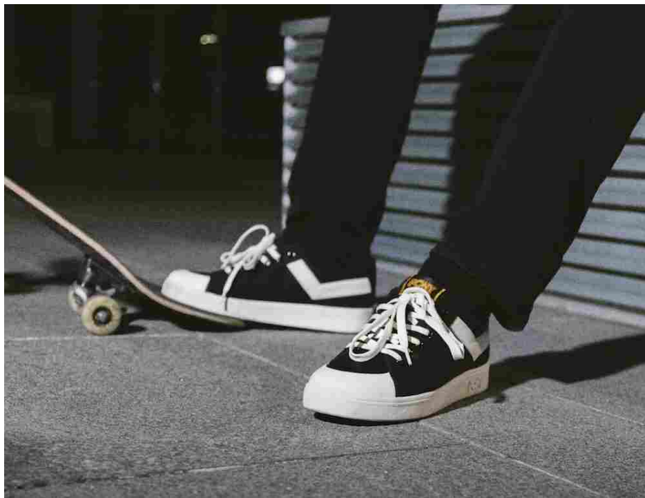
Le nuove Slamdunk di PONY, nei classici colori nero, blu e bianco

1988. Dedicato al basket e indossato dai seguaci della cultura street, si presenta in 3 colorazioni classiche: blu, nero e bianco. La silhouette è fortemente e volutamente allineata a quella delle scarpe da pallacanestro dell'epoca. Indossata da campioni NBA del calibro di Bob McAdoo, Cedric Maxwell, Earl Monroe, David Thompson, John Havlicek, Darryl Dawkins e Wilt Chamberlin. Ma tanto accattivante da essere utilizzata come urban sneaker da milioni di persone, che l'hanno sdoganata per l'uso fuori dal campo. Ergendola ad icona dello street style.