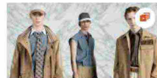
Il guardaroba di Fendi è perfetto per il weekend