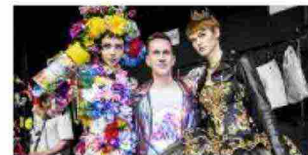
Come Jeremy Scott ha fatto rinascere Moschino