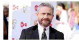
Martin Freeman è il meglio vestito del momento