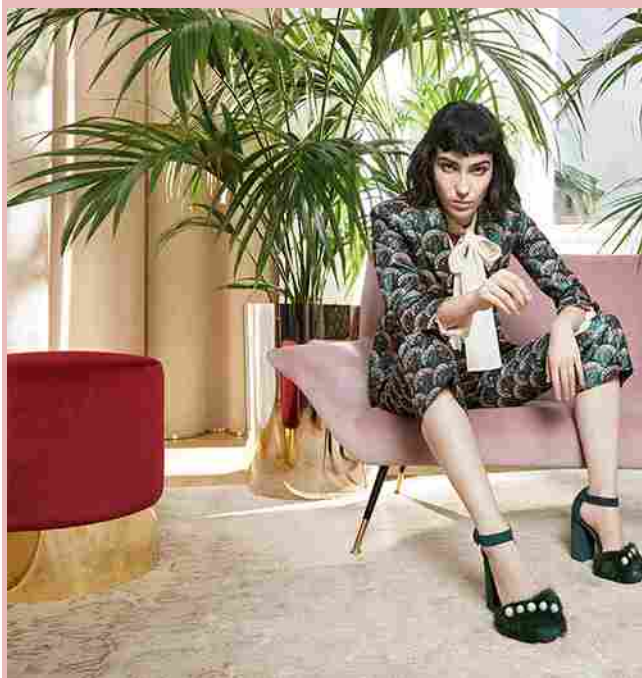
L'Autre Chose Showroom Milano Via A. Manzoni 20, angolo Via Montenapoleone, P. 02 7631 6037 www.lautrechose.com

Sator Private Equity Fund nel 2016 ha rilevato un'ulteriore quota della società, arrivando all'84% per dare vita ad un nuovo corso del brand .