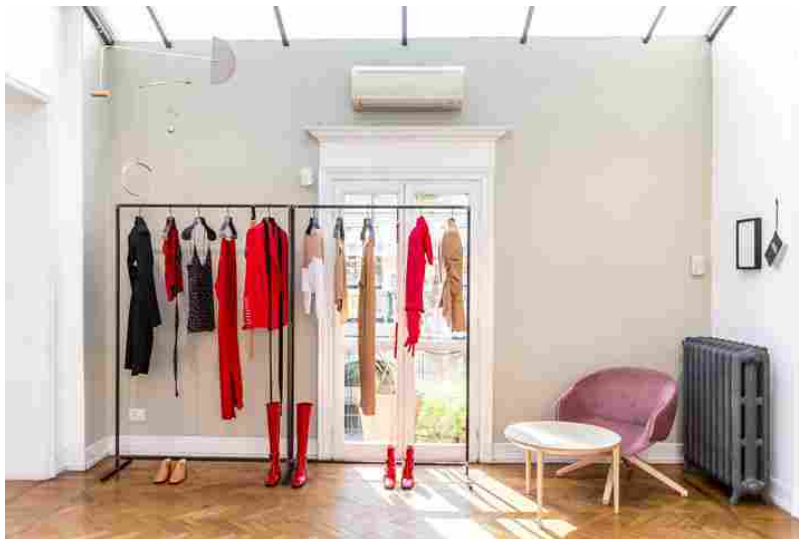
White@Archiproducts Milano: un dialogo tra moda e design